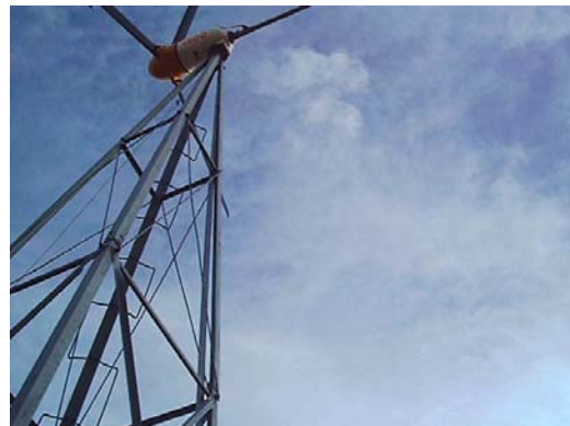
Figura 4 - Aerogenerador BWC1500 funcionando nuevamente