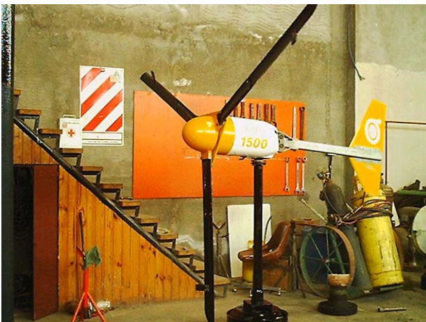
Figura 2: Armado de Equipo Completo (Setra SRL)

Según se indicó en el Informe-Diagnóstico , el día 7 de agosto de 2000, y a requerimiento de la ex-empresa INGEZA, L&R Ingeniería realizó un intento de recarga del banco de baterías de Ch-Ak 12, utilizando un cargador especial de 48V / 15A. Los resultados no fueron los esperados, y 8(ocho) de las baterías no presentaban señales de recuperación. (Los bancos de baterías tanto de Ch-Ak 12 como de SR-Ch 7 constan de 24 unidades de 6V, divididas en 3 hileras serie de 48V, 220Ah nominales). Las 16 baterías restantes mostraron una mejor capacidad de recuperación pero su rendimiento no era garantizable. Por lo tanto, se recomendó el reemplazo del