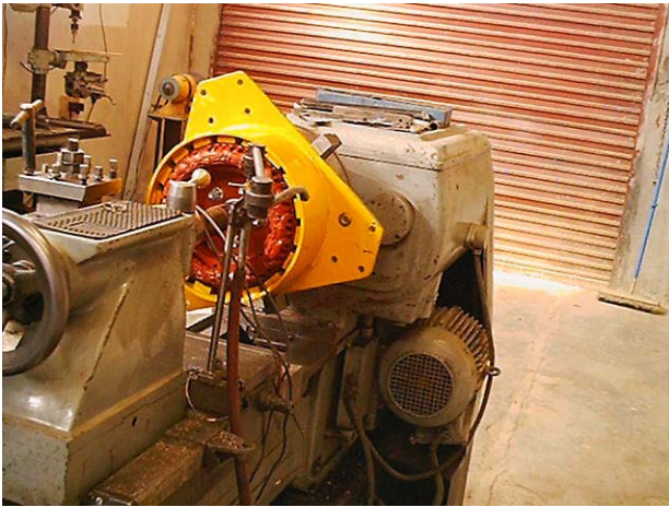
Figura 1: Ensayo de bobinado en Torno (Setra SRL)

Por imposibilidad de reparar localmente a los estándares adecuados el bobinado del equipo Bergey 1500, se procedió en febrero de 2001 a realizar la importación del bobinado completo, de 25kg de peso, desde la fabrica Bergey Windpower Co. en EE.UU. A efectos de controlar el sistema eléctrico, se realizaron (figura 1) pruebas dinámicas del conjunto bobinado-rotor sobre torno. Esto permitió controlar el correcto desempeño del repuesto. Posteriormente se realizó el reemplazo del flexible dañado del cable de freno, y la revisión de los contactos rozantes.