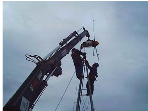
Figura 3 - Montaje del Aerogenerador BWC1500 por personal de Setra SRL

Finalmente, se trabajó sobre la instalación eléctrica de 48V, para el conexionado de las nuevas baterías y la remoción de las dañadas, que quedaron a disposición del personal de PECOM Energía S.A. Con el banco, regulador y convertidor desconectados se realizó el nuevo juego de conexiones. Verificadas las mismas, se procedió a conectar en primer término el el Bus-CC (llave T2) y luego el regulador (llave T3). Se verificó un nivel de tensión del banco